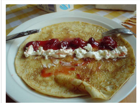
La Chandeleur, fête des crêpes.

Il existe encore de nos jours toute une symbolique liée à la confection des crêpes. On fait ainsi parfois sauter les crêpes de la main droite en tenant une pièce (un Louis d'or) dans la main gauche afin de connaître la prospérité pendant toute l'année. On dit aussi que la première crêpe confectionnée doit être gardée dans une armoire et qu'ainsi les prochaines récoltes seront abondantes [5] .